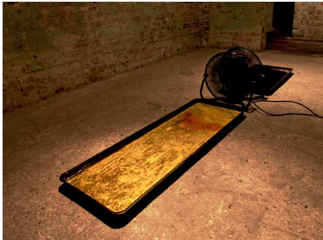
Division d'espace - version champignon - 2014