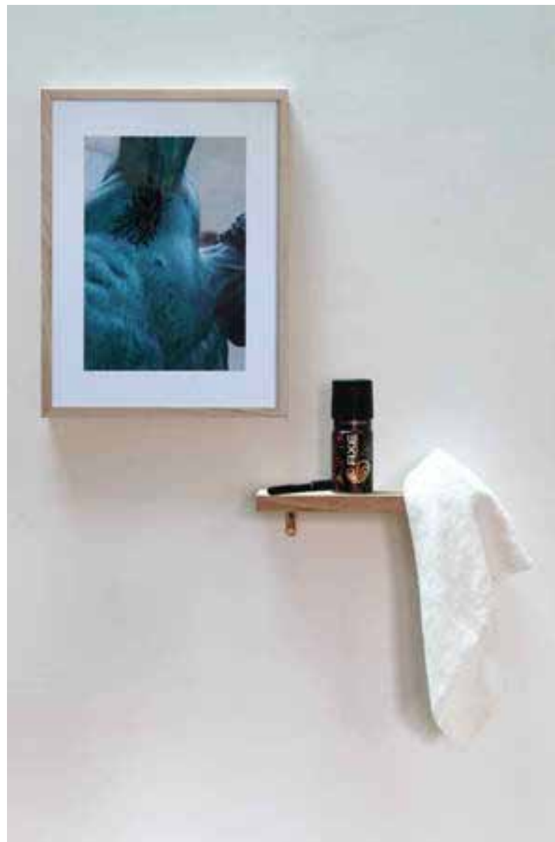
Hercule combattant Achéloüs métamorphosé en serpent – 2011

L'odeur comme point de départ, comme point de retard : le parfum exprime toujours le moment d'après, un peut-être embrumé. Embaumer l'instant, tel est le défi posé par le travail de Boris Raux. Son art olfactif est nécessairement art de l'évènement. L'artiste chorégraphie les trace à la fois tangibles et immatérielles de corps – humains ou objets – passés là, le temps d'une danse, et offre ces suspensions d'existences au spectateur, le temps d'un échange. Méthodiquement, presque scientifiquement, il recrée une absence, une ambiance. Un fragment d'espace-temps dont la fragrance est l'unité de mesure. Avec la méthodologie situationniste, il partage également le concept de détournement. Par une récupération parodique des produits de la société de consommation, criards et outranciers, Boris Raux nous renvoie de celle-ci l'équivalent olfactif d'un miroir déformant. Ses narrations acidulées à l'humour décapant sont autant de critiques des phénomènes sociétaux et de la commodification de l'odorat.